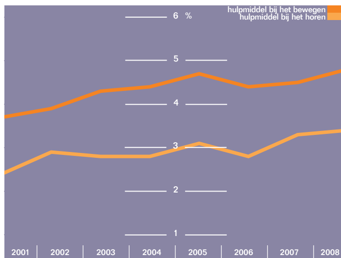
Aandeel Nederlanders met een hulpmiddel bij het bewegen of horen