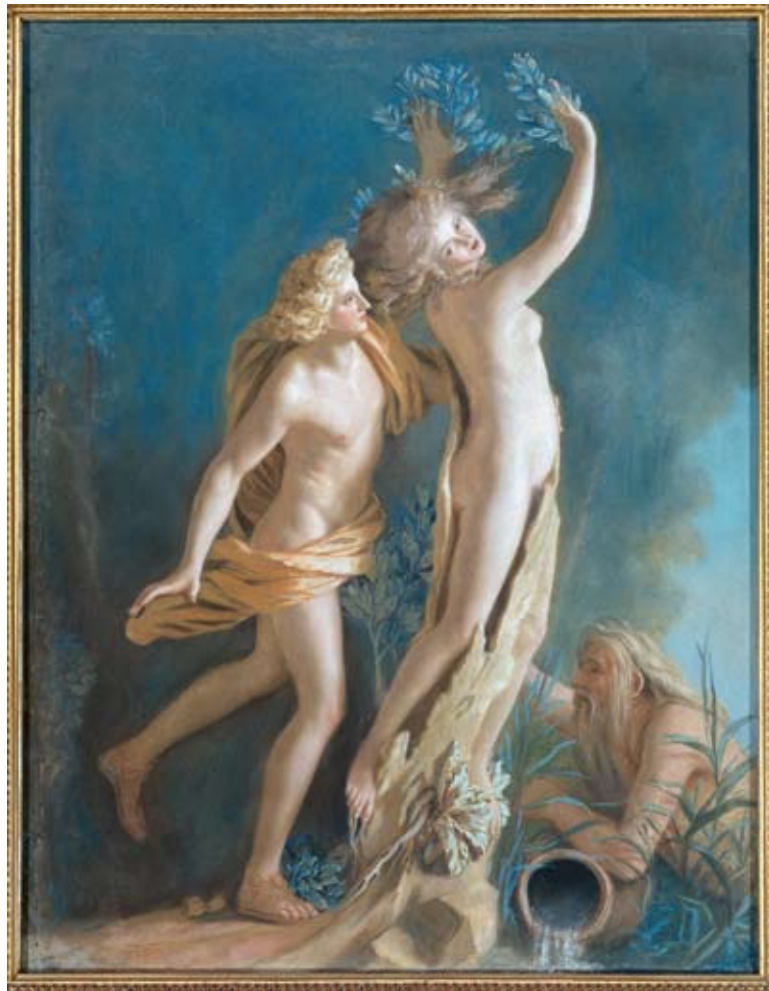
Bernini, Apollo en Daphne. Daphne verandert in een boom om te ontsnappen aan Apollo. Naar aanleiding van Ovidius' Metamorfosen .

De studiedag leverde geen definitief antwoord op de vraag of Google wel geschikt is voor de wetenschappelijke wereld. Maar wel bleek opnieuw dat Google in de commerciële markt een zeer belangrijke plek inneemt en dat bijna iedere zoekmachine, ook de wetenschappelijke, met Google wordt vergeleken. (LS)