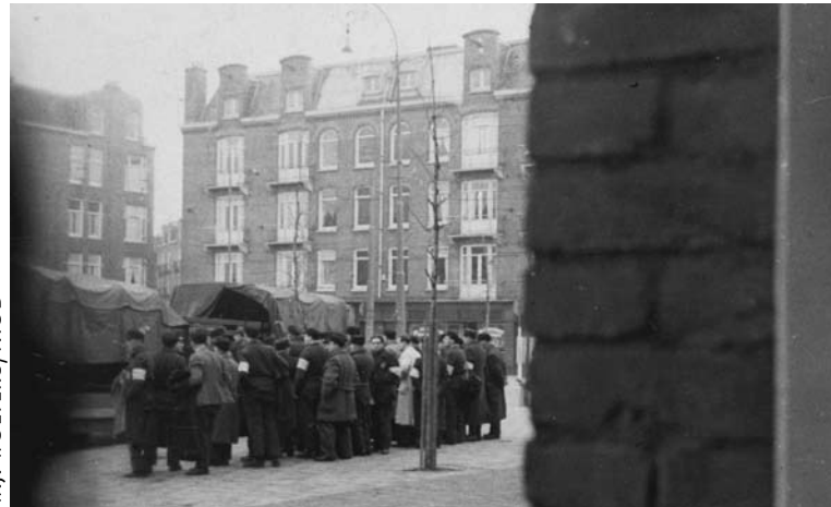
Razzia op het Amsterdamse Paul Krügerplein, 20 juni 1943.

gebruik van hoogwaardige opname-apparatuur voor een elk interview dient goed gedocumenteerd te worden. Transcripties maken de interviews inhoudelijk toegankelijk. Enkele belangrijke interviewcollecties zijn al laagdrempelig en open toegankelijk, maar voor veel andere geldt dat niet – ook los van privacybescherming en auteursrechten. Voor het project Getuigen Verhalen is de openbare toegang tot de interviews een belangrijke doelstelling. Daarom zal dat project een presentatie verzorgen op de studiedag Interviews uit de Kast die op 14 maart georganiseerd wordt (zie Agenda, p.2). (Rene van Horik)