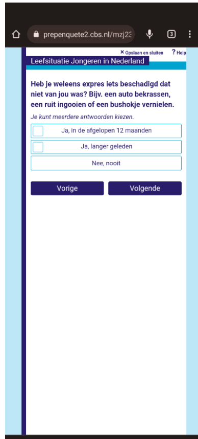
Figuur 6 Voorbeeld van vraag naar delinquent gedrag met meerkeuze antwoord

Er zit verschil in hoe respondenten omgaan met relatief onschuldige zaken als eens een notitieblok meenemen van school (met medeweten van een docent), een geleende pen niet teruggeven, een broertje pijn doen bij een stoeipartij etc. Sommigen melden dit, anderen niet. Met name bij online criminaliteit wordt bij inloggen vaak iets relatiefs onschuldigs genoemd. Zie voorbeelden hieronder.